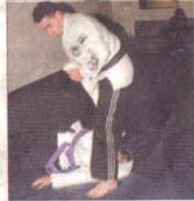
Para repeler un ataque se emplean técnicas que abrevan en las artes marciales clásicas, aplicadas a una nueva realidad cotidiana